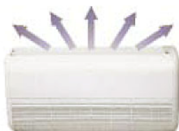
Izquierda - Derecha