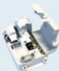
Controlador FCC (opcional)